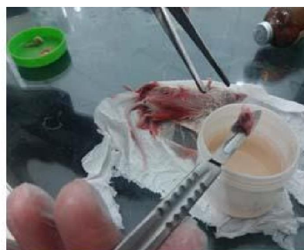
شکل ۱: مرحله ایجاد و جداسازی تومور